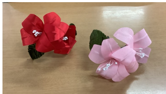
「入学式でつけたコサージュをまだ持っています!」