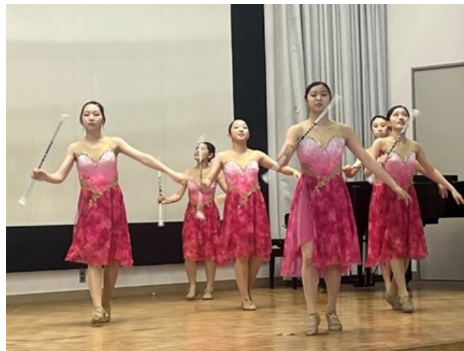
バトン部による演技