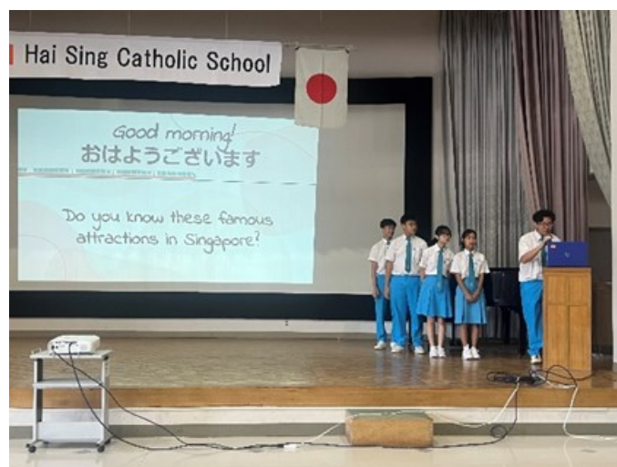
ハイシンスクールによる