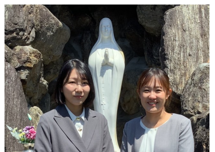
スクール・カウンセラー（ブライコース）

「人生100年時代」と呼ばれる今、皆さんとこの高校生活で出会えたことは必然だったのかもしれません。家庭科は調理や被服、保育など多岐の分野にわたり、将来の生活に潤いを与える科目です。「今」という時間を大切にしながら、充実した日々を送れるように一緒に頑張っていきましょう！