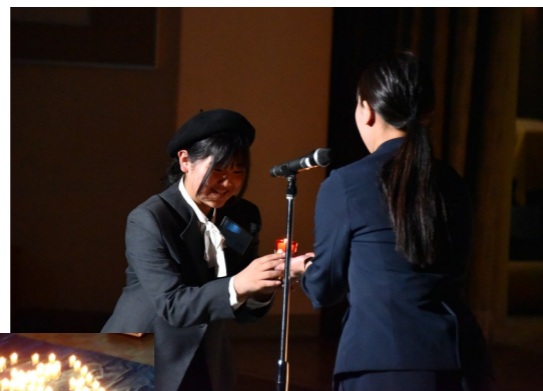
◀キャンドルで描いた校章